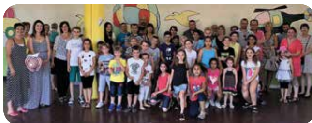
Accueil des parents au Grand Ban