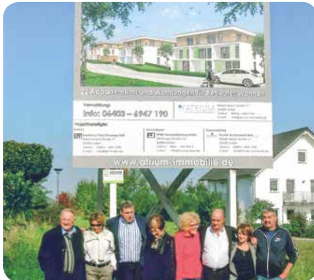
Construction d'une résidence senior à Langgöns baptisée Résidence Platz Clouange

Plus récemment, en juin 2017, Stéphane BOLTZ et quelques élus se sont rendus à nouveau en Allemagne, invités par le maire allemand Horst RÖHRIG aux 40 ans du