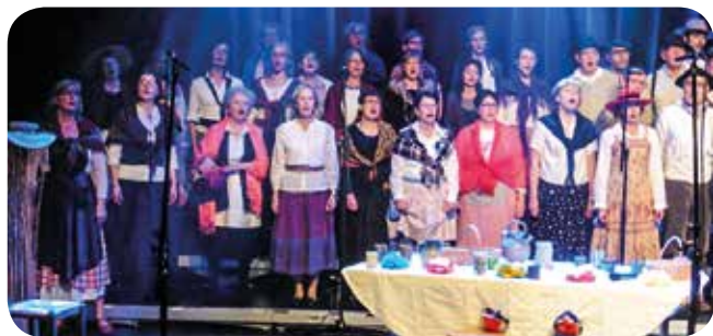
De l'opérette à la comédie musicale, une histoire de chœur

Comme chaque année un concert a été proposé aux habitants à l'occasion du Nouvel an. C'est la "chorale coup de chœur" de Plappeville Loisirs qui a eu le plaisir d'animer cette première soirée spectacle de l'année 2017. Un concert de qualité intitulé "De l'opérette à la comédie musicale" interprété par une formation de 60 choristes mosellans.