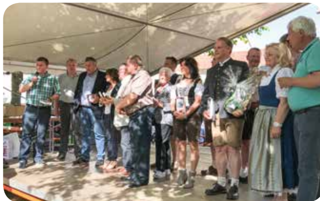
Le comité jumelage clouangeois reçu à Langgöns le 9 juin 2017

regroupement de communes de Langgöns. A n'en pas douter, ces rencontres ont contribué à faire renaître des liens chaleureux et confraternelles entre les deux villes, témoignage d'une solide amitié franco-allemande.