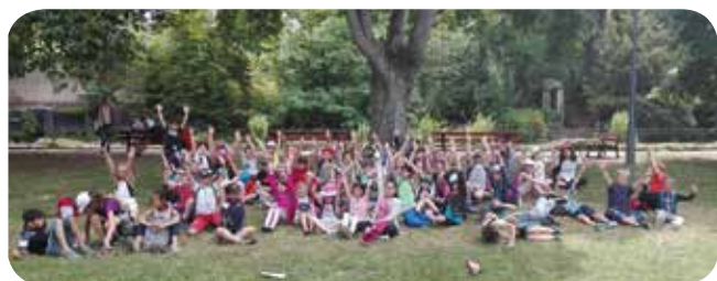
Le grand Ban visite Metz