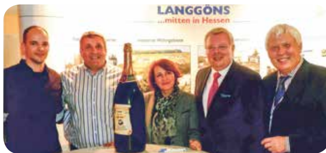
Comité franco-allemand pour les 40 ans du jumelage